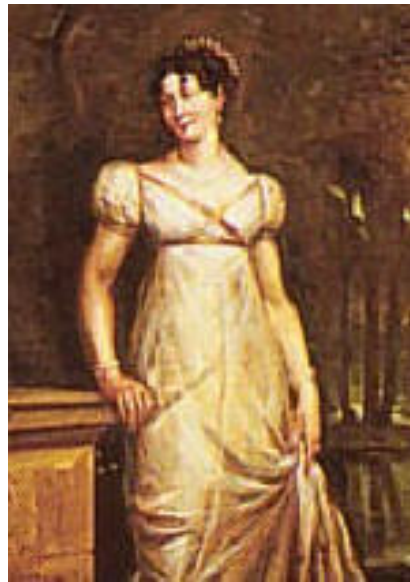
Dvě podobizny Terezy Amalie Matyldy, kněžny Thurn a Taxis, rozené princezny meklenbursko-střelické

Mladá nevěsta byla nejen krásná a chytrá, ale i vzdělaná, emancipovaná, energická a zejména cílevědomá. Toužila po tom, aby se sama stala vládkyní tohoto významného a bohatého knížecího domu. Brzy po jejím příchodu do Řezna začaly spory mezi ní a benediktinským knížecím opatstvím, které bylo zároveň i sídlem knížecí rodiny. Princezna si prosadila, aby se