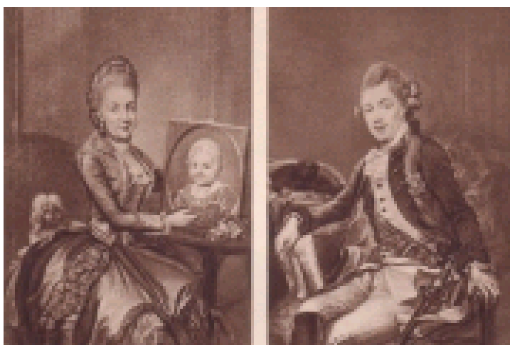
Karel II., vévoda meklenbursko-střelický (1741-1816) a jeho manželka Friederike, lantkraběnka Hesensko-Darmstadtská (1752-1782)