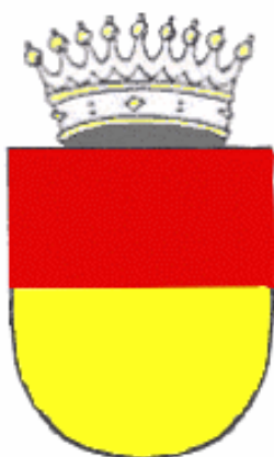
Erb hrabat ze Stockau